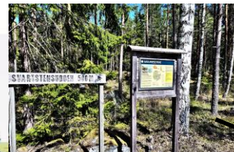
SVARTSTENSUDDEN NATURRESERVAT Klicka!