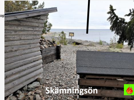
SKÄMMINGSÖN NATURRESERVAT Klicka!