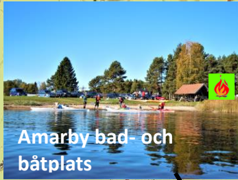
Amarby bad- och båtplats